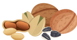
ОРЕХИ И СЕМЕНА